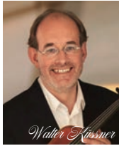
ヴァルター・キッスナー ベルリン・フィルハーモニー管弦楽団