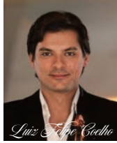
ルイス・フィリペ・コエリョ ベルリン・フィルハーモニー管弦楽団 第1ヴァイオリン