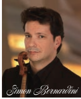
シモン・ベルナルディーニ ベルリン・フィルハーモニー管弦楽団 第1ヴァイオリン