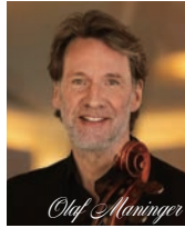
オラフ・マニング ベルリン・フィルハーモニー管弦楽団 首席チェロ奏者