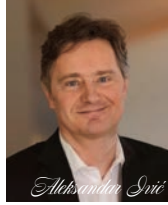
アレクサンダー・イヴィッチ ベルリン・フィルハーモニー管弦楽団 第1ヴァイオリン