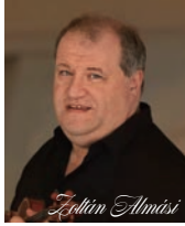
ゾルタン・アルマジ ベルリン・フィルハーモニー管弦楽団 第1ヴァイオリン