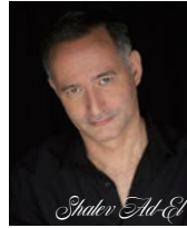
シャレフ・アド=エル